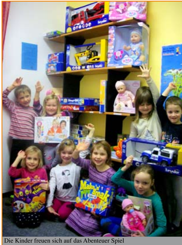
Die Kinder freuen sich auf das Abenteuer Spiel

„Hurra, wir haben gewonnen!“ Wir haben die Möglichkeit genutzt und uns für das Projekt „KiTa-Spielothek“ beworben. Bereits im siebten Jahr wird dieses Projekt vom „Mehr Zeit für Kinder e.V.“ ausgeschrieben. Ziel dieser Initiative ist es, Erziehungspartnerschaften zwischen Familien und KiTas zu fördern und die Spielkultur in den Familien zu stärken.