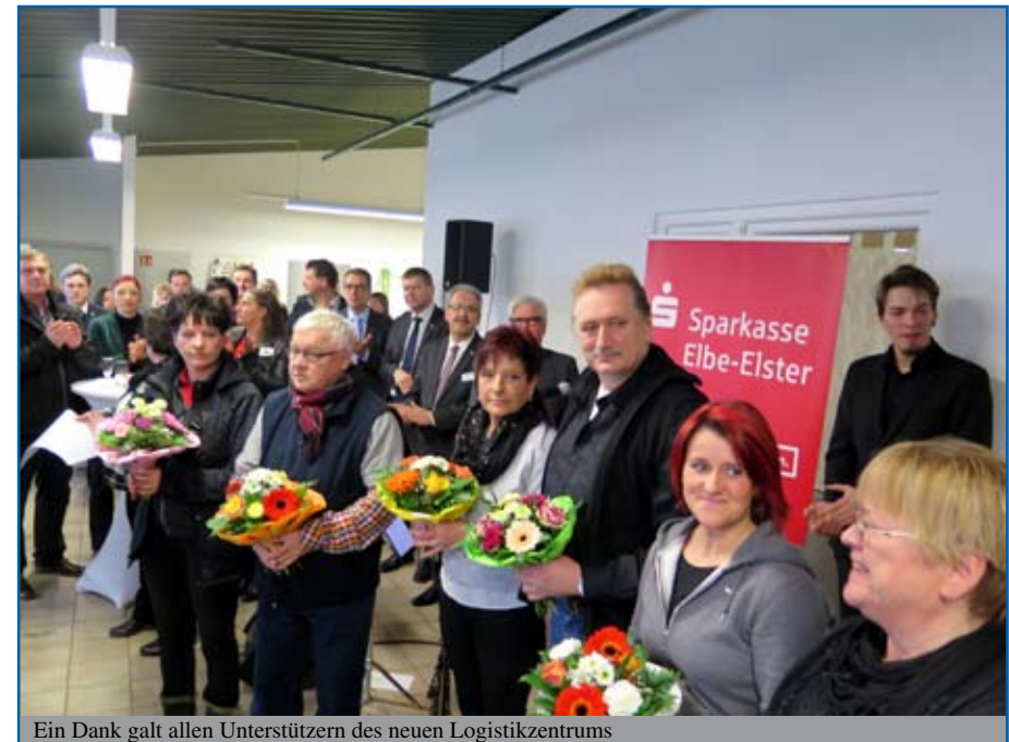
Ein Dank galt allen Unterstützern des neuen Logistikzentrums