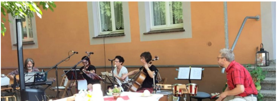
Führung im und um das Melanchtonhaus