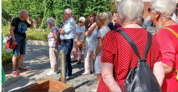
Führung im und um das Melanchthonhaus