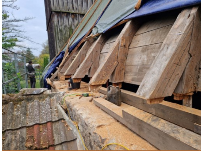
Viele Balkenenden müssen ersetzt werden.

Die Bauarbeiten in Breitenau gehen voran: Wenn die Dachziegel entfernt sind, dann erst sieht man den Zustand der Hölzer darunter, vor allem auf den Auflageflächen. Mehr als gedacht musste erneuert werden. Die Gottesdienste und Veranstaltungen finden zur Zeit vor der Kirche statt. Für die nötige Sanierung sammelt die Kirchengemeinde und dankt herzlich für die bereits gespendeten Gelder.