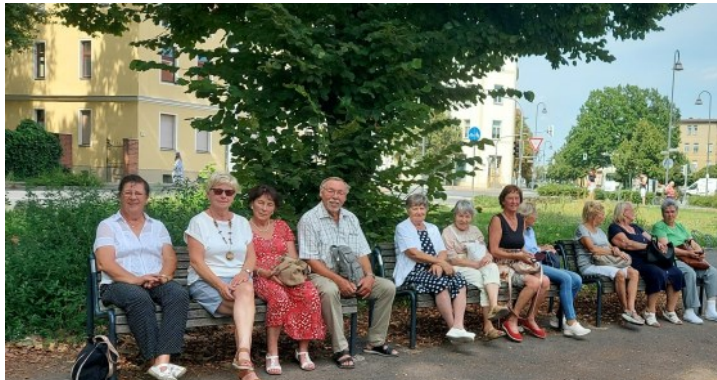
Kurze Pause vor dem Panorama