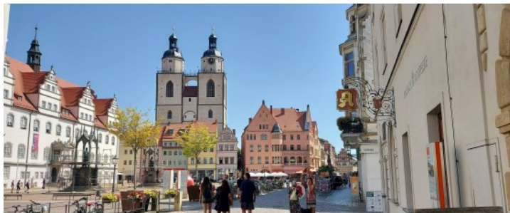
Auf dem Markt in Wittenberg