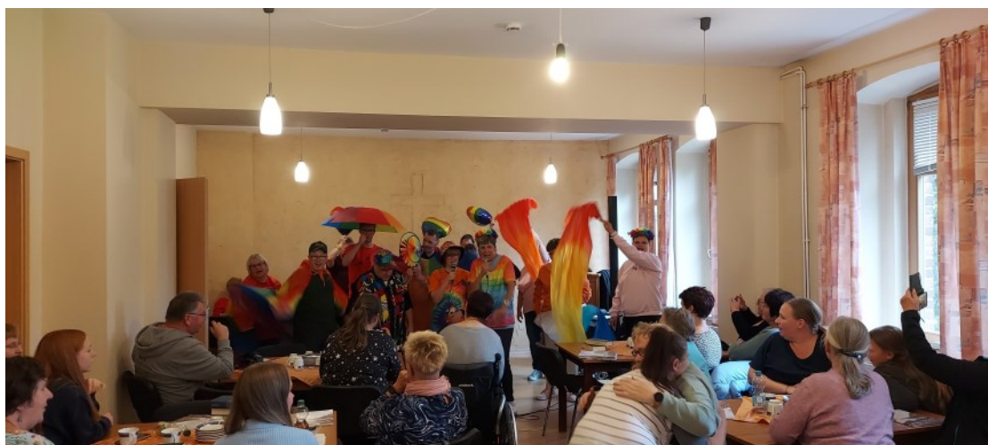
Farben- und Lebensfroh - der Chor „Lebensfroh“ zu Gast in Nehesdorf