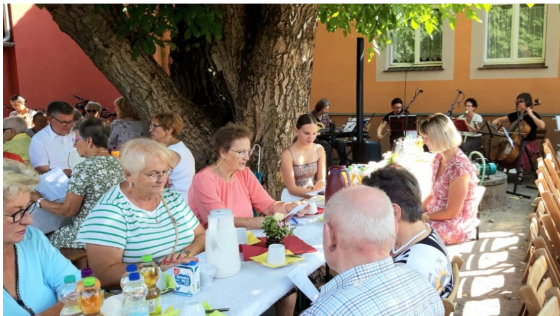
Gemeinsames Singen neuer Lieder