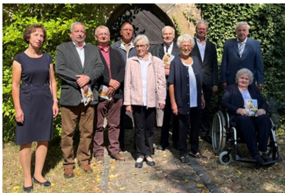
Die Bettener Jubilare

Jubilare verschiedener Jahrgänge erinnerten sich in Betten an ihre Konfirmationen. Nach dem gemeinsamen Gottesdienst freuten sich alle Jubilare auf das Zusammensein.