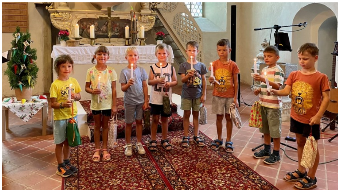
Die Erstklässler nach Segen und Geschenkübergabe