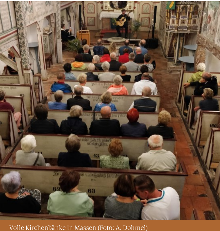
Volle Kirchenbänke in Massen