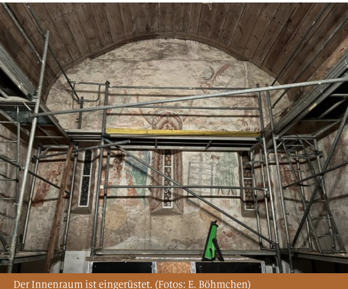
Der Innenraum ist eingerüstet.

PS: Die Kirchengemeinde hat auch einen Instagram-Kanal! Schauen Sie mal rein!