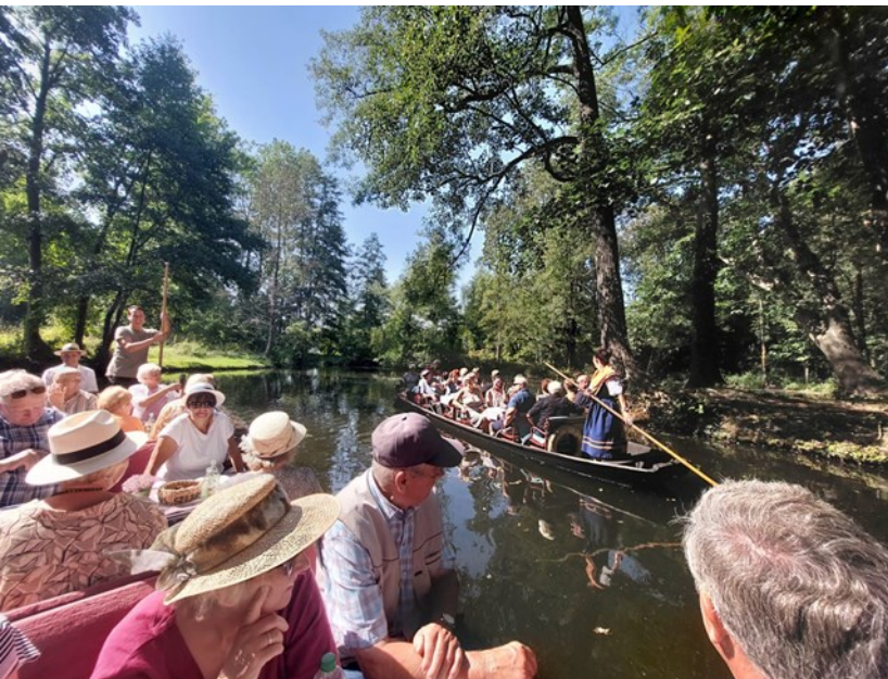
Mit zwei Kähnen im Straupitzer Hafen gestartet