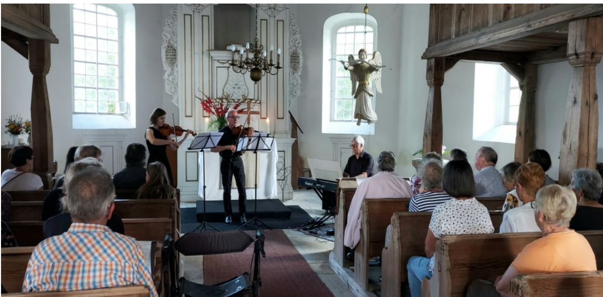
Mehr Sommer. Mehr Musik. Mehr gute Laune.