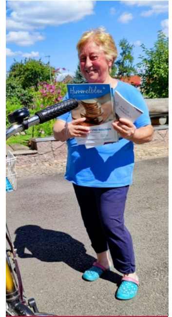
Das Gemeindeblatt kommt.