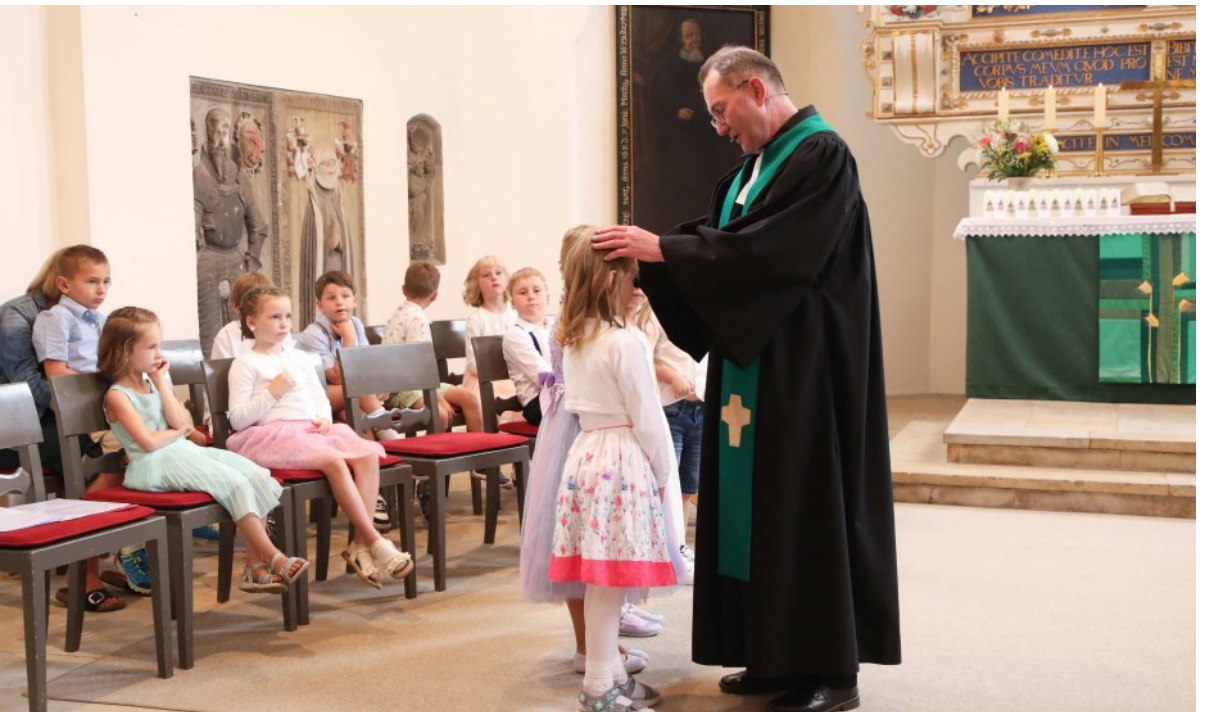
Die Schulanfängerinnen und Schulanfänger werden gesegnet