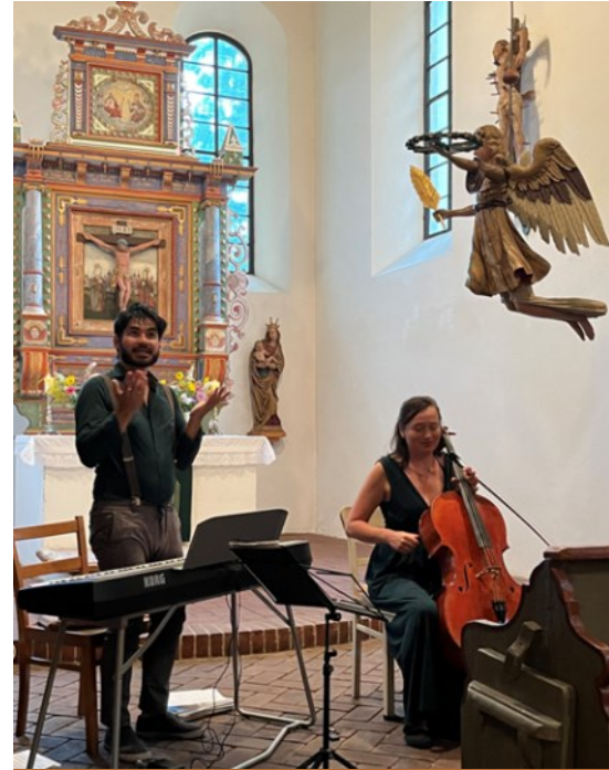
Das Duo Prinzipal in Göllnitz