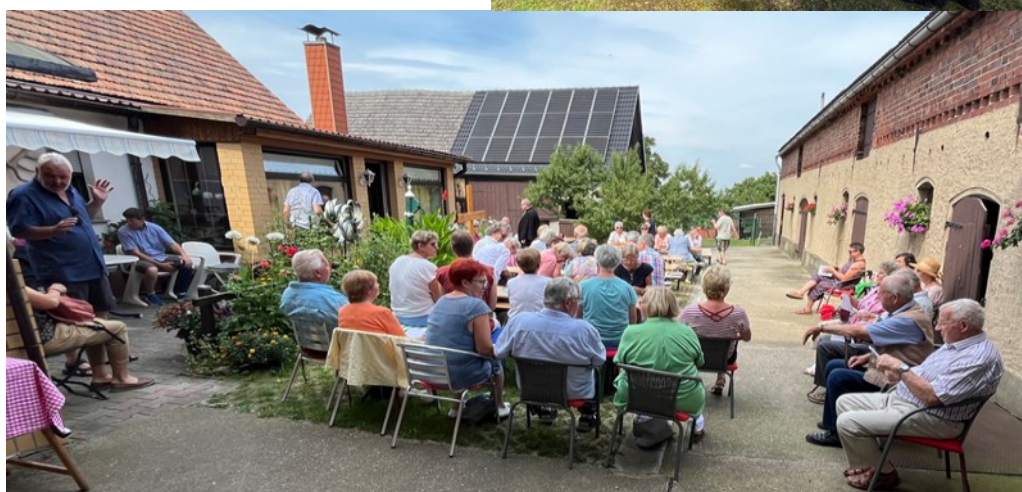
Sommerkirche in Fürstlich Drehna (oben) und in Bergen (unten)