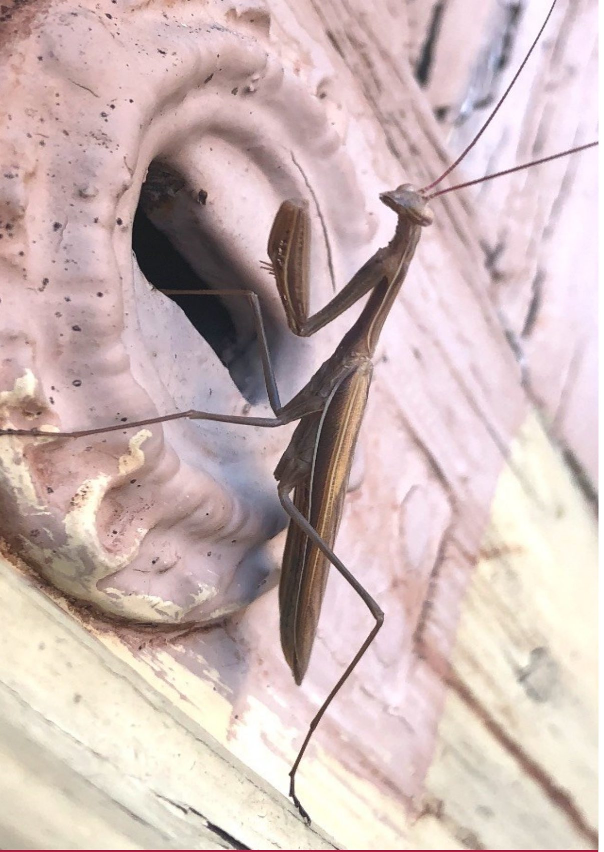
Gottesanbeterin an der Kirchentür Sonnewalde