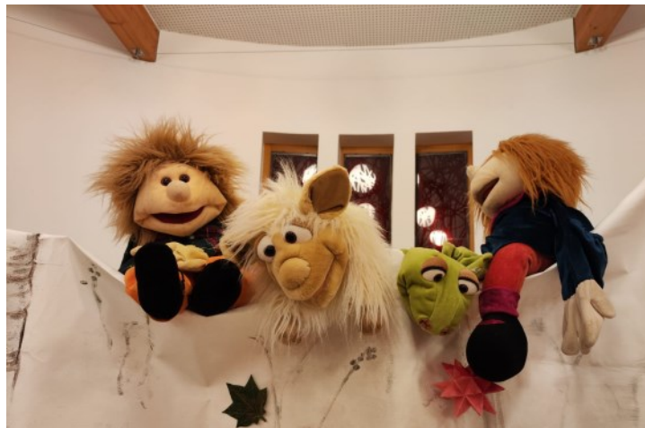
Hier unser wunderbares Puppenspiel mit Mathilda, Arnold, Wolli und Moritz, dem Advents- und Weihnachtssicherheitsbeauftragten.