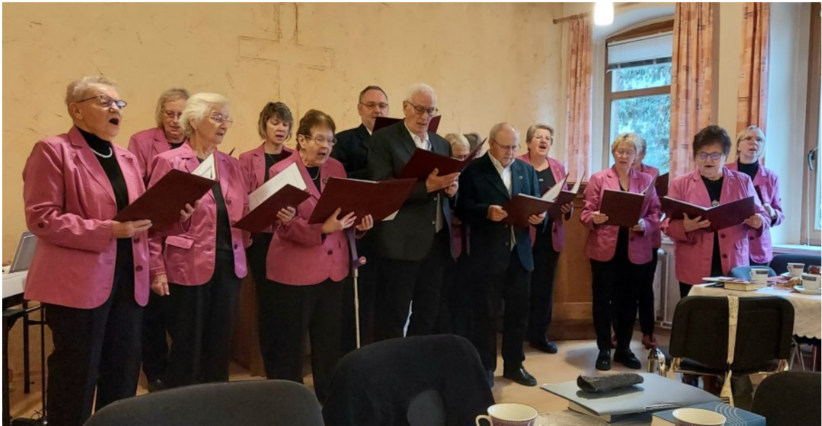
Der Polizeichor zu Gast bei der Adventsfeier