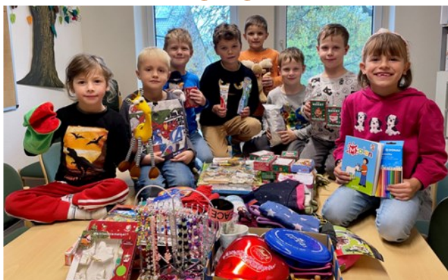
Paketaktion in Betten

Sehr fleißig waren im Spätherbst die Christenlehrekinder des Pfarrsprengels Betten. Sie haben 15 prall gefüllte Pakete für Kinder in Not gepackt.