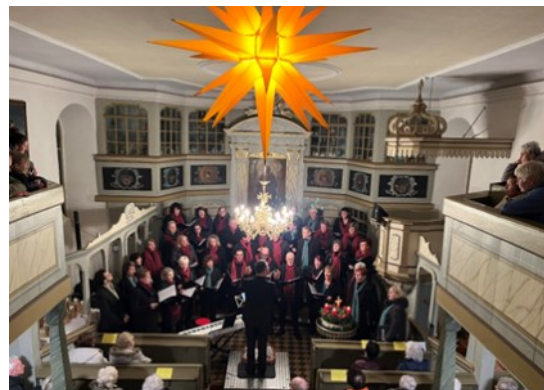
Wormlage: Musik im Kerzenschein