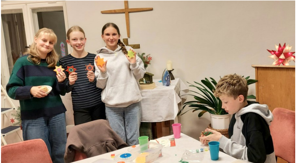
Adventsbasteln in Sorno