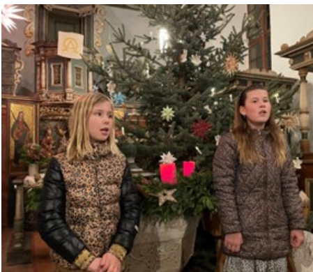
Betten: Musik im Kerzenschein