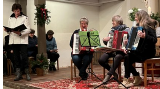
Dollnchen: Akkordeon-Trio und Geschichten

Der Advent war voller Musik: in Massen, Lieskau, Dollnchen (2) und Wormlage (2) waren Konzerte und im Januar in Betten die 21. Musik im Kerzenschein. Sehr schön und sehr viel. Manche Kirchen waren ganz voll, manche waren (mehr als) halb leer. Jeder Ort bereitet voller Hingabe vor und lädt ein. Wünschen wir denen, die soviel Arbeit und Zeit investieren auch die erhoffte Resonanz. Musik tut der Seele gut. Zuhören, seinen Gedanken nachgehen und mitsummen oder mitsingen ist so wohltuend. Gerade die Advents- und Weihnachtslieder sind (noch) so vertraut und das gemeinsame Singen macht so große Freude. Herzlichen Dank allen Mitwirkenden an dieser Stelle und denen, die die Kirchen vor- und nachbereitet haben.