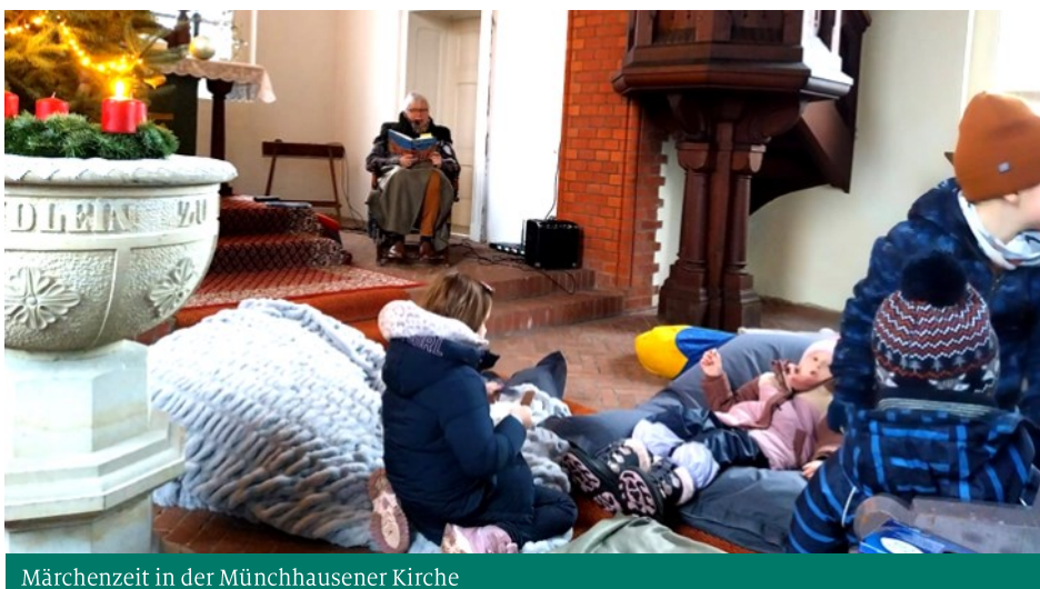
Märchenzeit in der Münchhausener Kirche