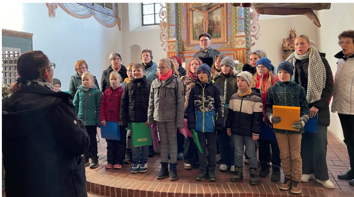
Gemeinsames Singen in Göllnitz