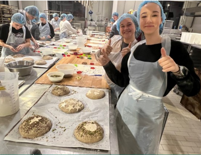
In der Backstube

Etliche Jahre schon gehört zum 1. Advent in unserer Kirchengemeinde die Aktion „5000 Brote— Konfis backen Brot für die Welt“.