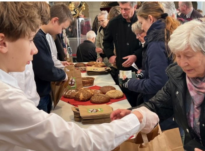
Verkauf der Brote nach dem Gottesdienst am 1. Advent