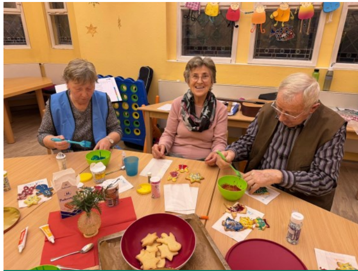
Kekse verzieren mal anders