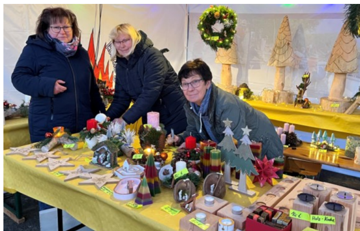
Weihnachtsmarkt mit Selbstgebasteltem der Kirche

Dörfliches Leben Breitenau e.V. der Kirchengemeinde für die Kirchensanierung übergeben. Ganz herzlichen Dank dafür! Vorher hatte ein Weihnachtsmarkt stattgefunden, in dem Gebasteltes und Selbstgemachtes verkauft wurde. Der Erlös war ebenfalls für die Kirchensanierung bestimmt. Nun, wo das