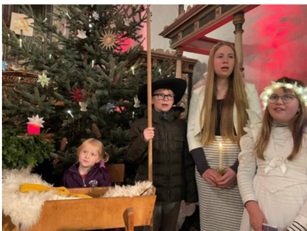
Krippenspiel in Betten