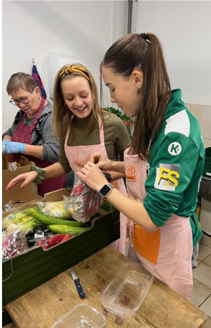
Konfirmandinnen helfen bei der Tafel mit