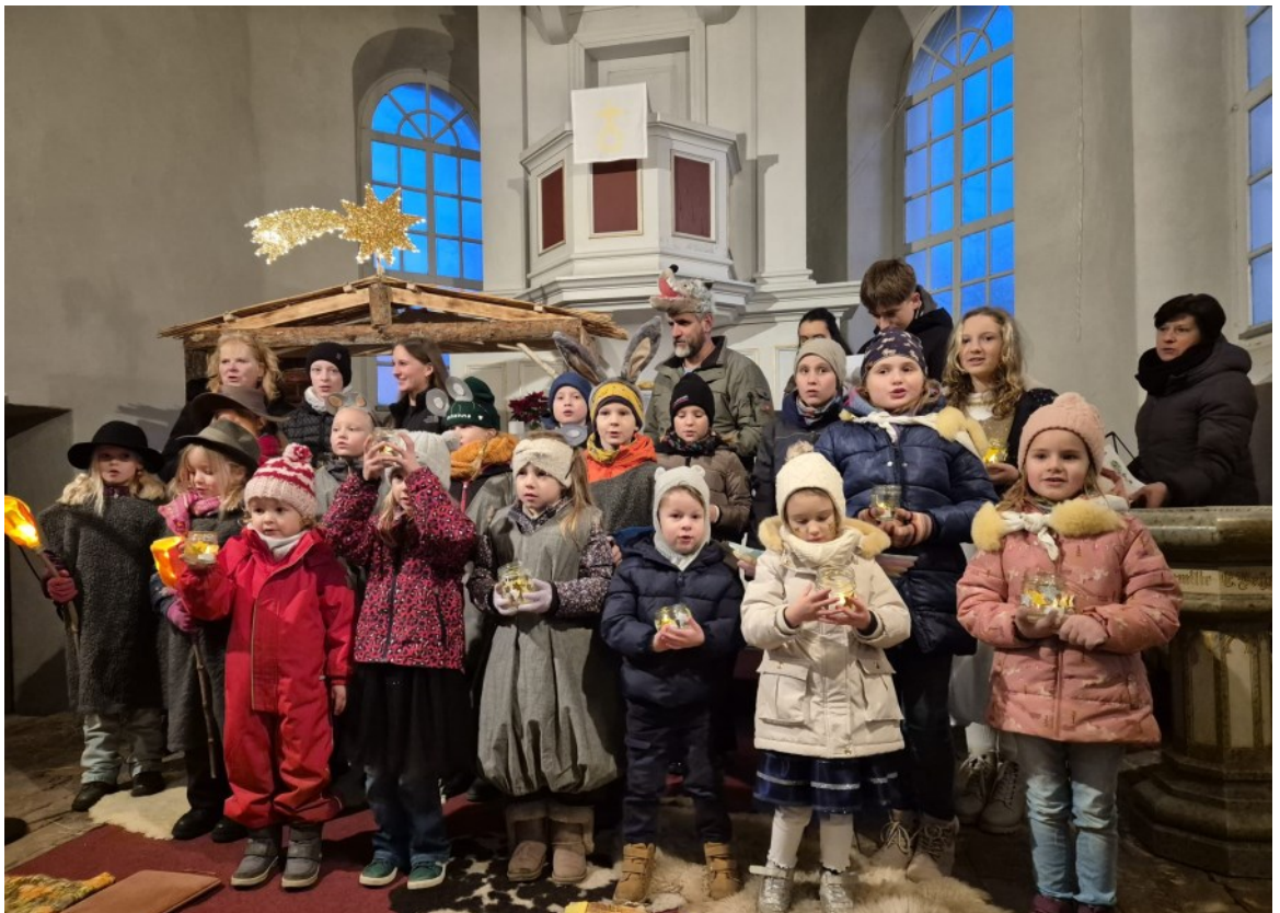
Krippenspiel in Sorno