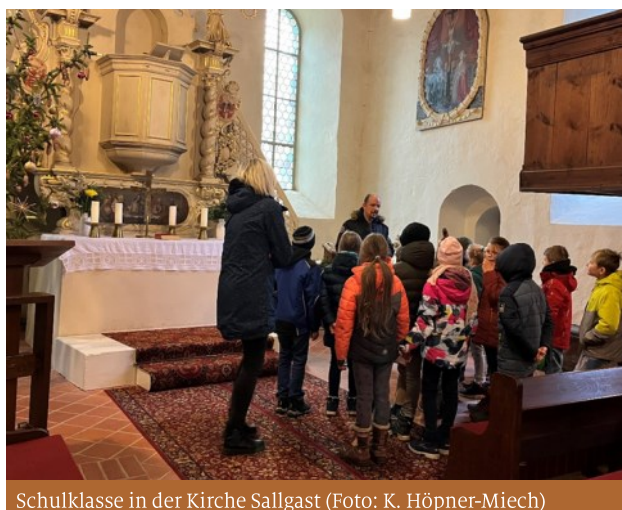
Schulklasse in der Kirche Sallgast

ten sie die Weihnachtsgeschichte. Die Lehrerinnen, die Kinder, Bert Griebner und Pfarrerin Höpner-Miech erzählten über Krippenspiele und Traditionen. Anschließend besuchte der Weihnachtsmann die Kinder im Gemeinderaum.