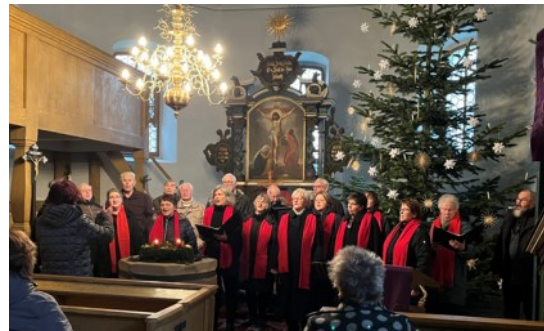
Lieskau: Frauenchor Lieskau & Männerchor Schönborn