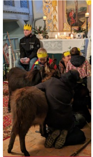
Esel im Gottesdienst

Leider war es nicht möglich, in Crinitz und Babben einen Gottesdienst zu feiern. Unsere Kapazitäten kommen einfach an Grenzen.