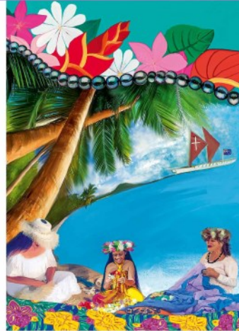
Bild zum Weltgebetstag 2025 mit dem Titel „Wonderfully Made“ von den Künstlerinnen Tarani Napa und Tevairangi Napa

Mehr Informationen: www.weltgebetstag.de