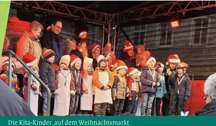
Die Kita-Kinder auf dem Weihnachtsmarkt

gramm geplant und Anfang Dezember begannen wir zu proben. Unser Kantor unterstützte uns sowohl bei den Proben als auch am Veranstaltungstag am Klavier.