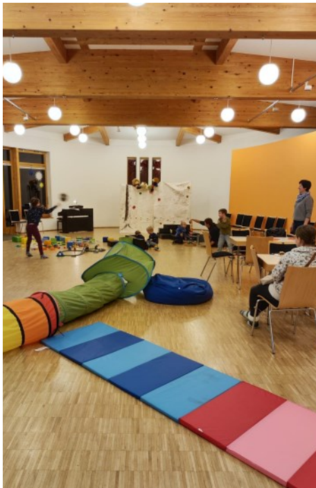
Spielen, Spaß haben und eine gemütliche Gemeinschaft genießen